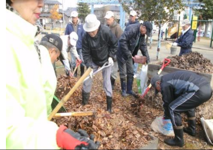
水、ヌカ、もみ殻、森のめぐみをまぜる