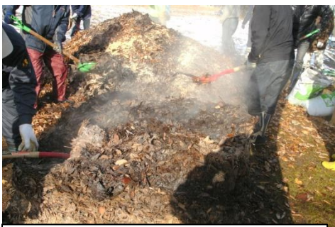
12月14日 3回目の切返しで発酵熱