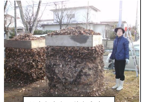
見事な高さに積上成功

★他にも青葉区中山市民センター、青葉区貝ヶ森1号公園、泉区泉ヶ丘町内会の花壇愛好会、太白区ひより台団地などから依頼を受けて「木枠による落ち葉堆肥作り」を当会有志が応援指導しています。