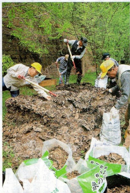
街路樹の落ち葉でできた堆肥を袋詰めする町内会役員たち＝仙台市青葉区の貝ヶ森1号緑地

仙台市青葉区貝ヶ森の住民が2012年秋から取り組んできた、街路樹の落ち葉を使った堆肥が出来上がった。約2トンの堆肥は、家庭園芸用に住民に順次配られる。放射性物質への懸念から実施が危ぶまれたが、関係者のこまめな測定で完成にこぎ着けた。